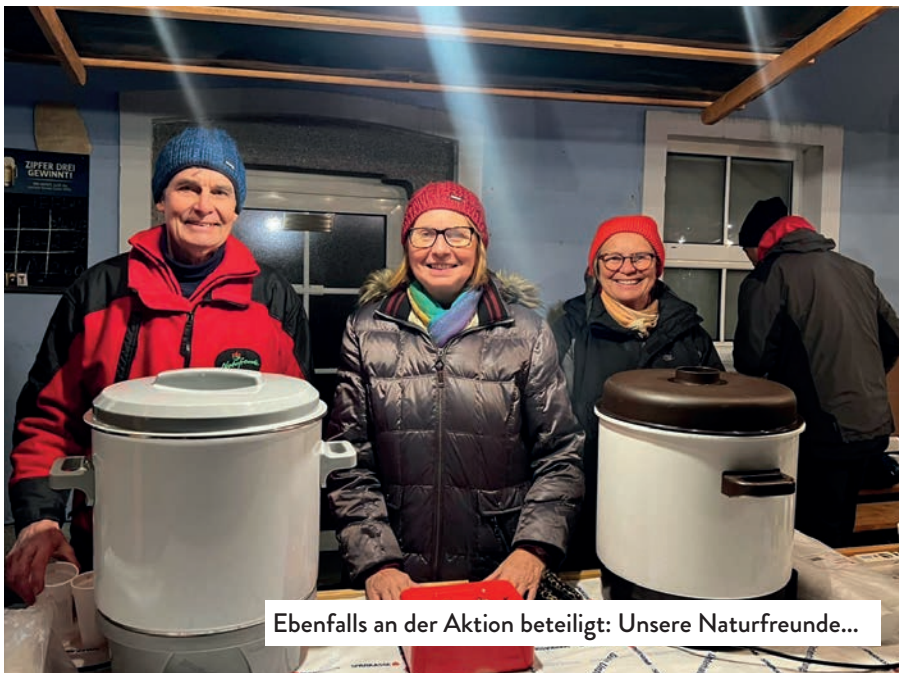
Ebenfalls an der Aktion beteiligt: Unsere Naturfreunde...