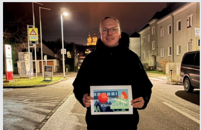
Ermäßigter Tarif beim AST für Klimatickets – nutzen Sie die sichere Fahrt!