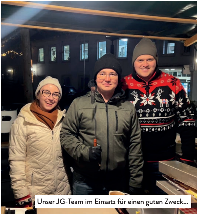
Unser JG-Team im Einsatz für einen guten Zweck...