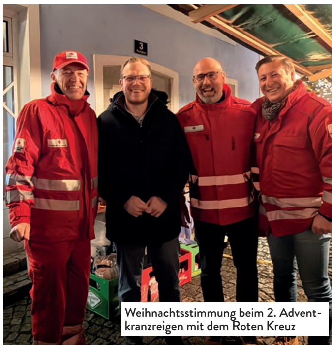
Weihnachtsstimmung beim 2. Adventkranzreigen mit dem Roten Kreuz