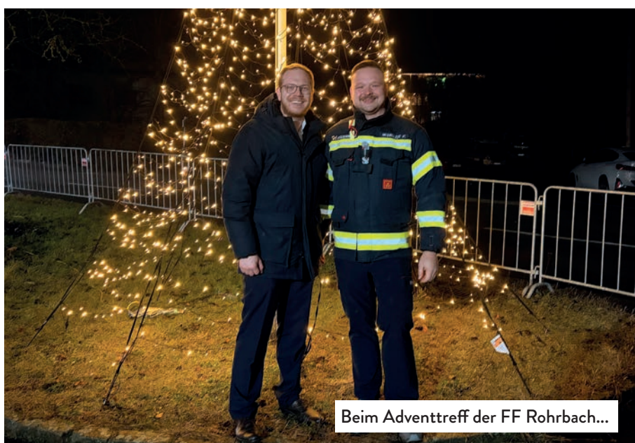
Beim Adventtreff der FF Rohrbach...