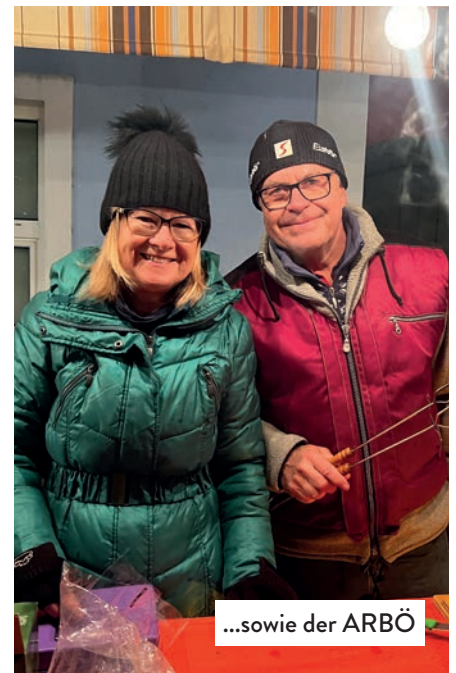
...sowie der ARBÖ