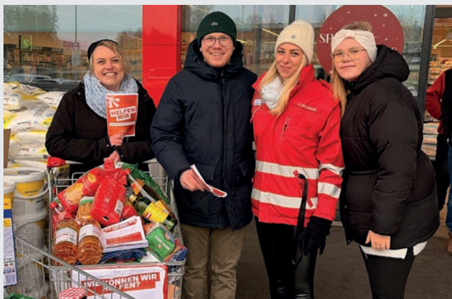
Vielen Dank für die zahlreichen Spenden für den Sozialmarkt!