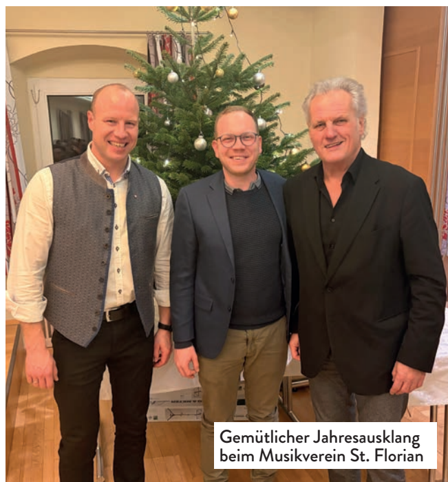
Gemütlicher Jahresausklang beim Musikverein St. Florian