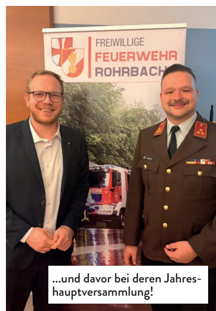
...und davor bei deren Jahreshauptversammlung!