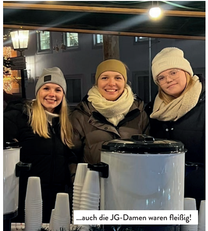
...auch die JG-Damen waren fleißig!